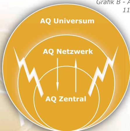
Grafik B - Al-Qaida nach dem 11. September 2001

■ Al-Qaida Zentral besteht aus dem Führungskader und ist unter anderem direkt verantwortlich für die Anschläge vom 11. September 2001, die Anschläge auf die US-Botschaften in Kenia und Tansania 1998 und auf die ‚USS Cole‘ im Jahr 2000. Seit 2002 wurden zwar weitere Anschläge geplant (z.B. auf britisch/US-amerikanische Flugverbindungen 2006 und auf die U-Bahn in New York City 2009), 14 der Schwerpunkt der Aktivität liegt jedoch auf der Propaganda und der Koordinierung des Netzwerkes.